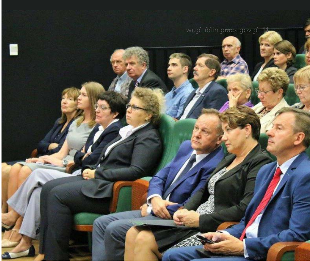
Uczestnicy konferencji - Wsparcie młodych warunkiem sukcesu.

Podczas konferencji zostały zaprezentowane najważniejsze aspekty dotyczące wdrażania Programu Operacyjnego Wiedza Edukacja Rozwój 2014-2020 oraz przedstawione dotychczasowe działania realizowanych przez WUP w Lublinie na terenie województwa lubelskiego, które są adresowane do osób młodych w wieku 15 - 29 lat pozostających bez pracy na lokalnym rynku. Na konferencji zostały omówione tematy które, stanowią duże wyzwania dla realizatorów projektów w zakresie oferowanego wsparcia dla osób młodych, udział osób z niepełnosprawnością w projektach unijnych oraz pozyskanie nowych miejsc stażowych, a także dalszego zatrudnienia u lokalnych przedsiębiorców uczestników projektów.