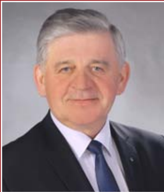
Sławomir Sosnowski Marszałek Województwa Lubelskiego

Wykorzystywanie środków unijnych na walkę z bezrobociem stwarza ogromne możliwości wszystkim osobom poszukującym pracy lub pragnącym zdobyć nowy zawód.