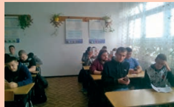
Zespół Szkół Ponadgimnazjalnych nr 3 im. Armii Krajowej w Zamościu