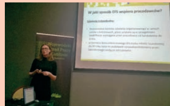
Spotkanie z przedsiębiorcami - Zamość