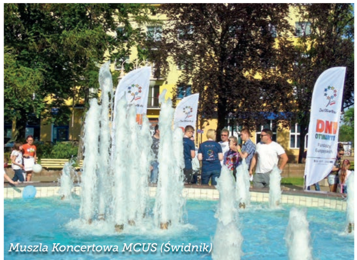
Muszla Koncertowa MCUS (Świdnik)