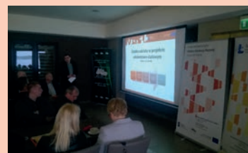
Spotkanie z przedsiębiorcami - Okuninka k. Włodawy