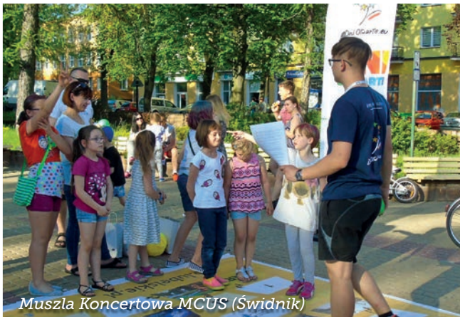
Muszla Koncertowa MCUS (Świdnik)