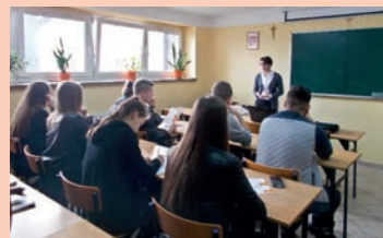
Zespół Szkół Zawodowych i Ogólnokształcących w Biłgoraju

Zapraszamy do kontaktu z Punktem informacyjnym PO WER ul. Lubartowska 74 A, I piętro, pokój 100 tel. (81) 46 35 349 lub kom. 605 903 493 e-mail: power@wup.lublin.pl www.power-wuplublin.praca.gov.pl