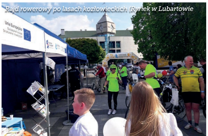
Rajd rowerowy po lasach kozłowieckich (Rynek w Lubartowie)