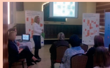
Spotkanie z przedsiębiorcami - Hrubieszów