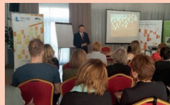
Spotkanie z przedsiębiorcami - Chełm