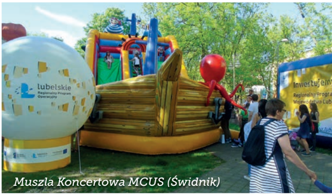
Muszla Koncertowa MCUS (Świdnik)