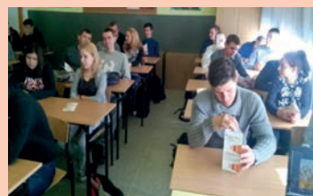
Zespół Szkół w Trawninkach