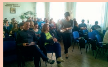
Zespół Szkół Ponadgimnazjalnych nr 2 im. B. Głowackiego w Krasnymstawie