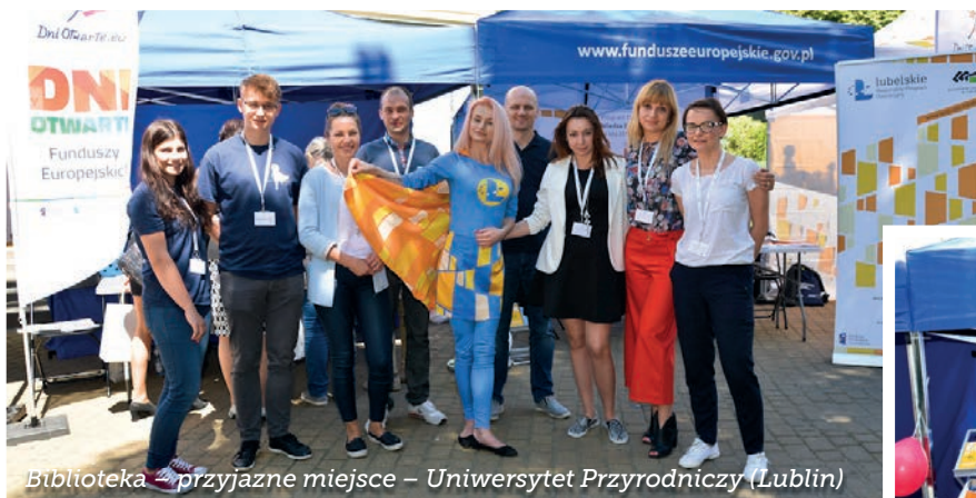
Biblioteka - przyjazne miejsce - Uniwersytet Przyrodniczy (Lublin)