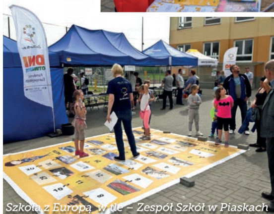
Szkola z Europą w tle - Zespół Szkół w Piaskach